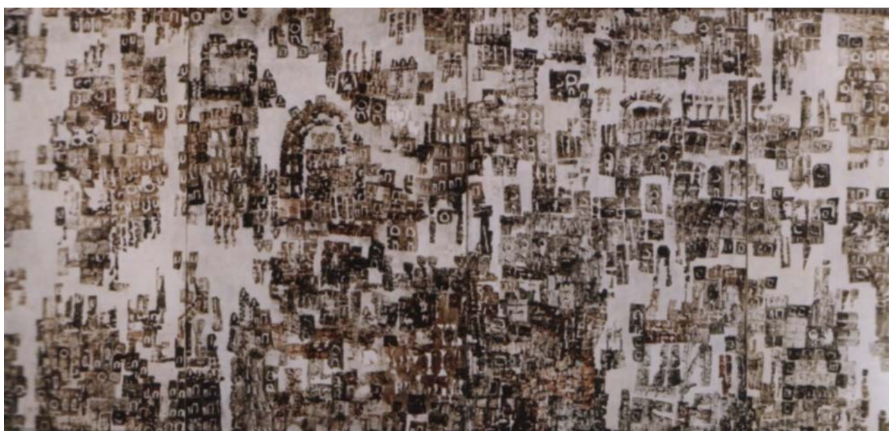
VÁROS A KIRÁLYOK KORÁBÓL II, 1965