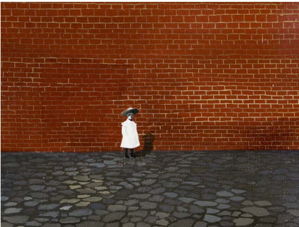
ÖNARCKÉP (Kislány fal előtt), 1955