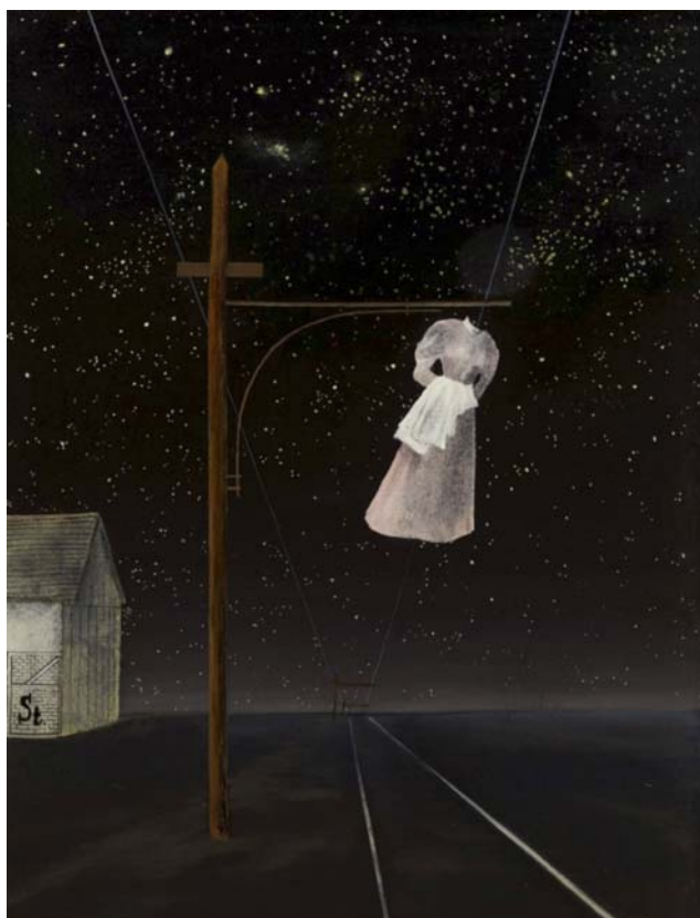
AKASZTOTT NŐ (Rózsaszín ruha), 1956