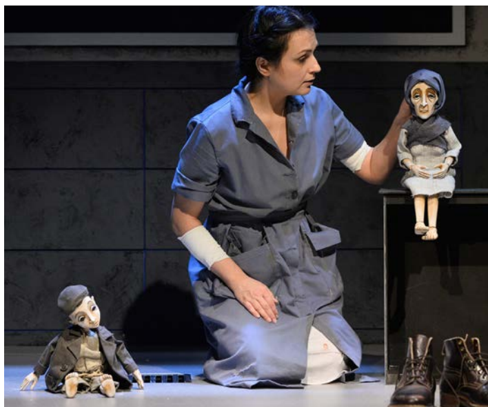
kisfiú – anya bunraku bábok