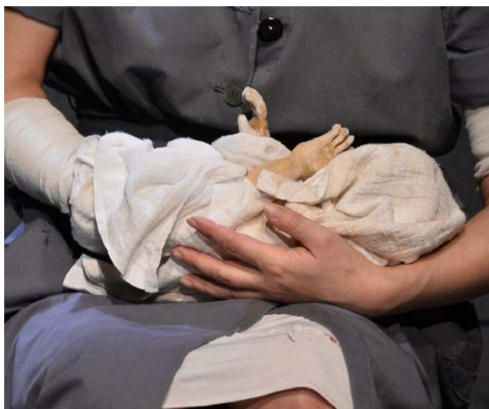
betakart kisfiú kesztyűs báb