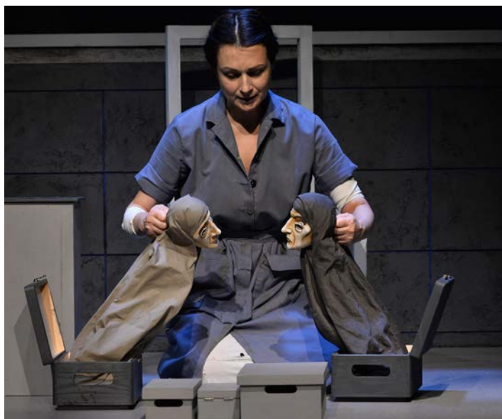
nagyanya – anya dobozos bunraku bábok kis dobozokkal