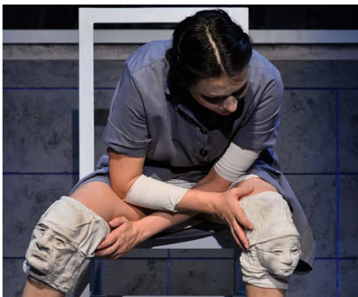
apa – fia térdbábok